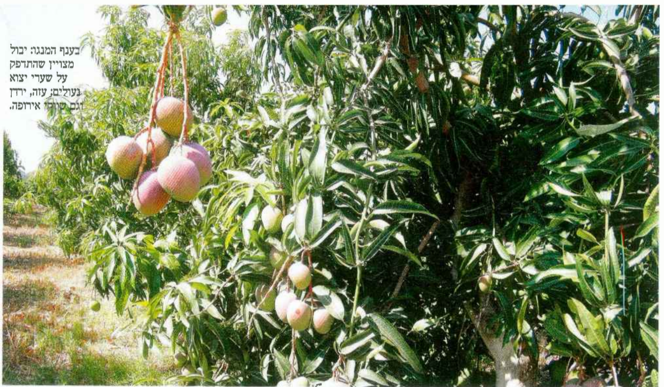
בענף המנגה יכול מצויין שהתדפק על שערי יצוא בעולים; עזה, ירדן וגם שוקי אירופה.

השנה החקלאית שעברה על הגולן למרות השנה השחונה הצליחו החקלאים לעמוד במכסות והיבולים היו סבירים. פרויקט חג של שישי בגולן עמ' 136