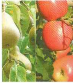
חג האסיף - סיכום השנה החקלאית שעברה על הגולן