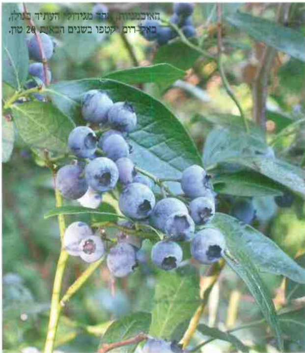
האוכמניות, אחד מגידולי העתיד בגולן, באג-רום נקטפו בשנים הבאות 20 טון.