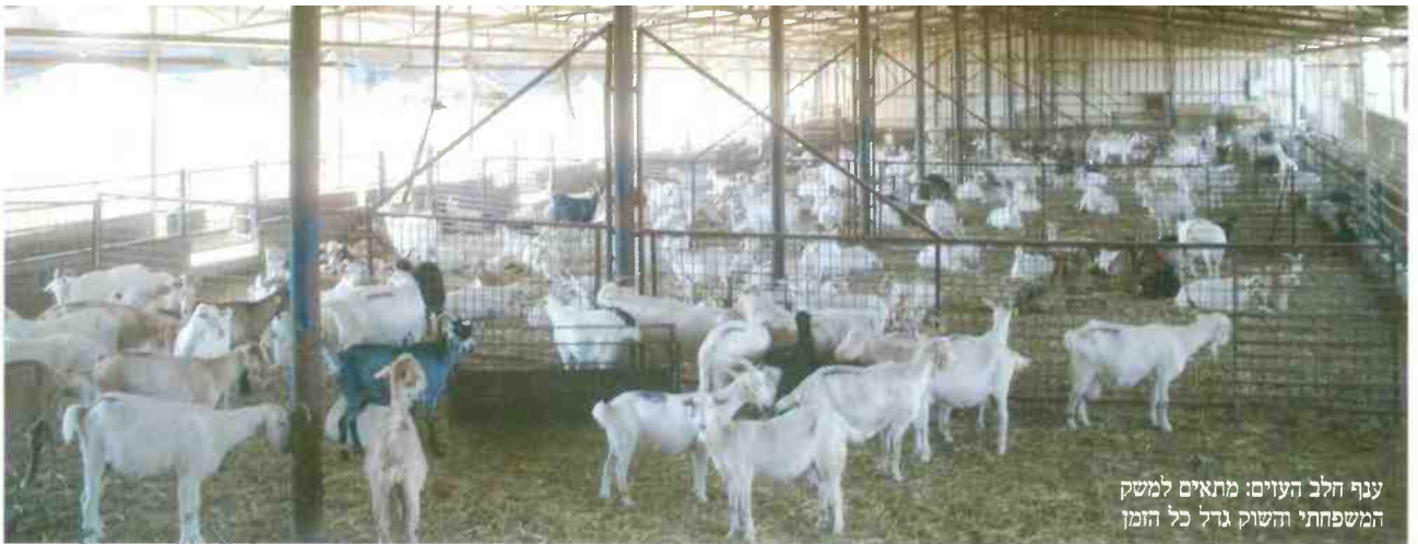
ענף חלב העוים: מתאים למשק המשפחתי והשוק גדל כל הזמן