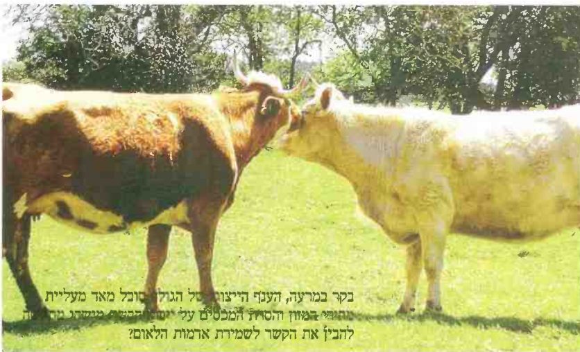
בקר במרעה, הענף הייצור של הגולן כובל מאד מעליית מחירי הגזון הסודי המכילים על יסודם משקל מרובה להכין את הקשר לשמירת אדמות הלאום?