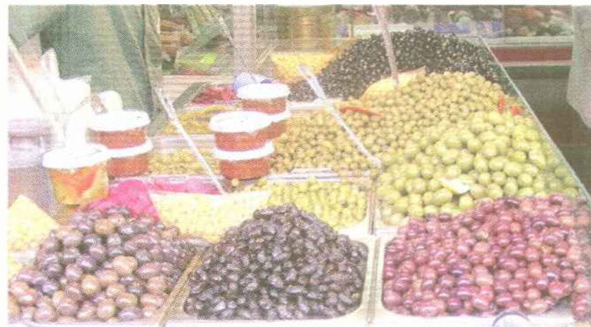
זיתים בשוקיה של ארץ ישראל