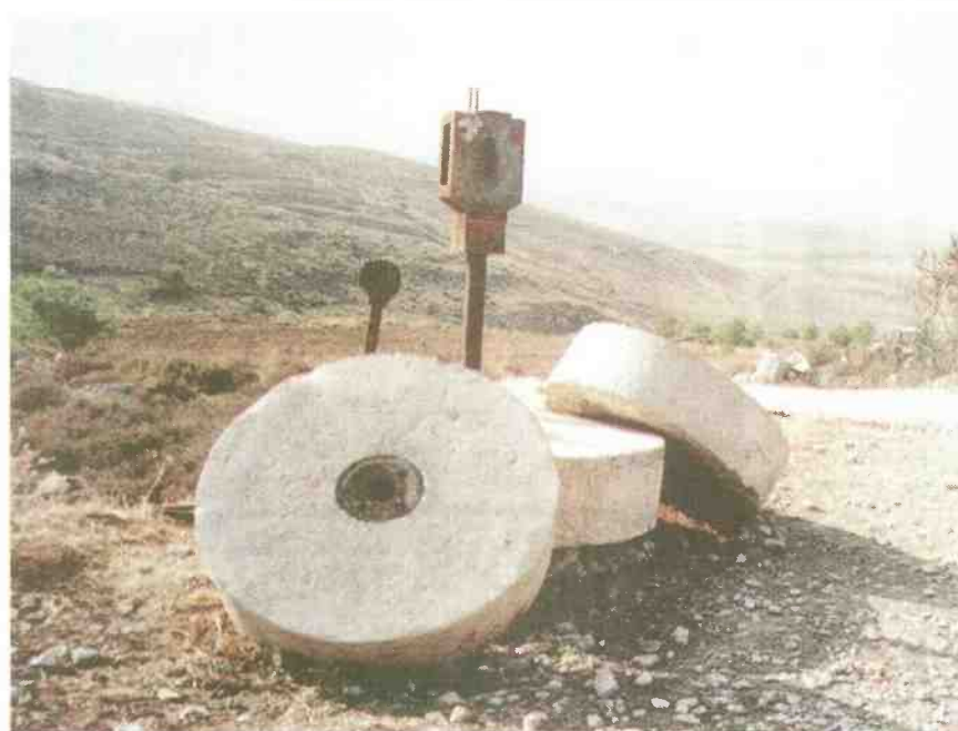
בית בד עתיק

בואו נעזוב את פרטי המייגעים של התחקיר, שהוכן בקפידה, ונלך רק לפרט אחד. עינבוס הוא כפר קטן ונידח-יחסית, שאינו מחובר לאף כביש ראשי בשומרון. באותו בוקר שבו התרחש הארוע, שהו בכפר זה יותר מ-50 פעילי שמאל, עיתונאים ישראלים וזרים. היש הסבר יותר מציאותי מזה שכל אלה הגיעו לכפר על פי תזמון מדויק עם בעליו של המטע, שפשוט תכנן את כל ההצגה מראש, והזמין את כל העיתונאים ופעילי השמאל?