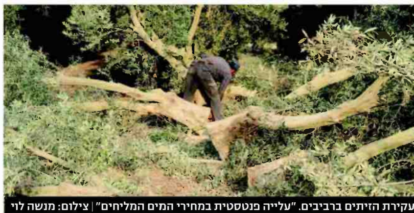
עקירת הזיתים ברביבים. "עלייה פנטסטית במחירי המים המליחים"

ההחלטה על העקירה הייתה מיידית, והיא כבר מבוצעת בפועל. בענף הזית של הקיבוץ אומרים שאין ברירה, שכן עלויות החזקת המטע הפכו כבדות ולא משתלמות, גם בתנאים של שנת יכול מוצלח. "מדובר באחד המטעים הגדולים בארץ ובחקלאים מצוינים. נושא ההשקיה ברמת הנגב מורכב ויקר, ולכן המדינה צריכה למצוא דרך לסייע למגדלי הזיתים ברמת הנגב בהוזלת עלויות ההשקיה", אומר מנהל ענף הזית ברביבים, ד"ר עדי נעלי.