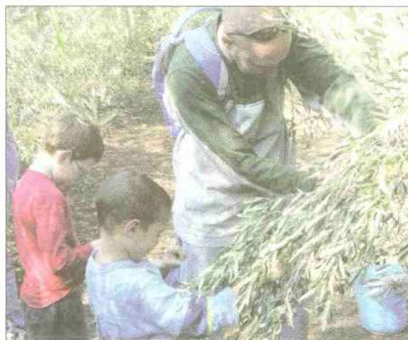
מוסקים זיתים

פסטיבל ימי ענף הזית חוגג את שנתו ה־20, ואתם מוזמנים לבילוי משפחתי של טבע ומעמים