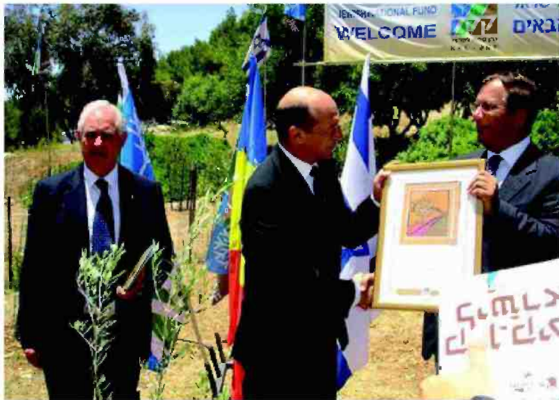
השגריר יצחק אלדן (משמאל) עם נשיא רומניה ויו"ר קק"ל אפי שטנצלר

מבקש להקים בארצו כרמי זיתים. יש, מסתבר, אינטרס רב בזית הישראלי. האפיפיור פרנציסקוס שאולי יבוא באביב הבא לישראל - חובב זיתים ושמני זית. גת שמנים היתה המקום בו התקיימה המיסה בעת ביקורו בארץ של האפיפיור הקודם. נושא הזית הוא בראש מיזם לשיתוף פעולה בין ישראל, ירדן, הרשות הפלשתינית ומדינות זית גדולות כאיטליה, צרפת ויוון בתחום המאבק בזבוב הים תיכוני ונקיים סמינרים בין לאומיים עם השכנים. הזית הופך להיות נושא מרכזי לשיחות תוף פעולה ולמאבק נגד אויבים משותפים. זה מקור פרנסה חשוב מאין כמוהו לחקלאי האזור."