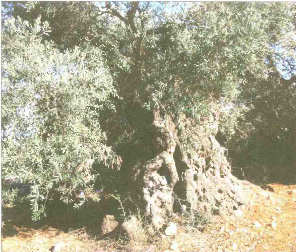
עץ זית קדום ביותר בדיר חנא.