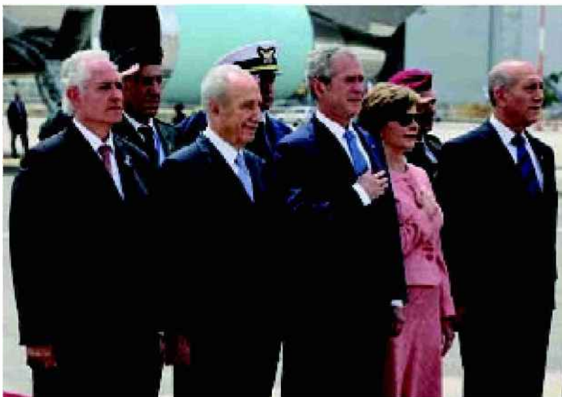
משמאל: השגריר יצחק אלדן, נשיא המדינה שמעון פרס, נשיא ארה"ב ג'ורג' בוש ורעייתו לורה וראש הממשלה אהוד אולמרט <<<

השגריר אלדן חבר למועצת הזית ובצוותא עם אמין חסן כוננו, בסיוע פעיל של הקרן הקיימת, את דרך הזית באירוע חגיגי בשנת 2008. "באותה שנה ביצענו בגינת הנשיא פרס בירושלים מסיק זיתים והכריזנו על דרך הזית בנתיבי ישראל. מאז חנכתי את דרך הזית בחיפה ובתל-אביב ומדי שנה מצטרף ישוב כזה או אחר לדרך הזית שפרוסה על פני ארבעה נתיבים: גליל עליון, גליל תחתון, שפלת החוף והנגב".