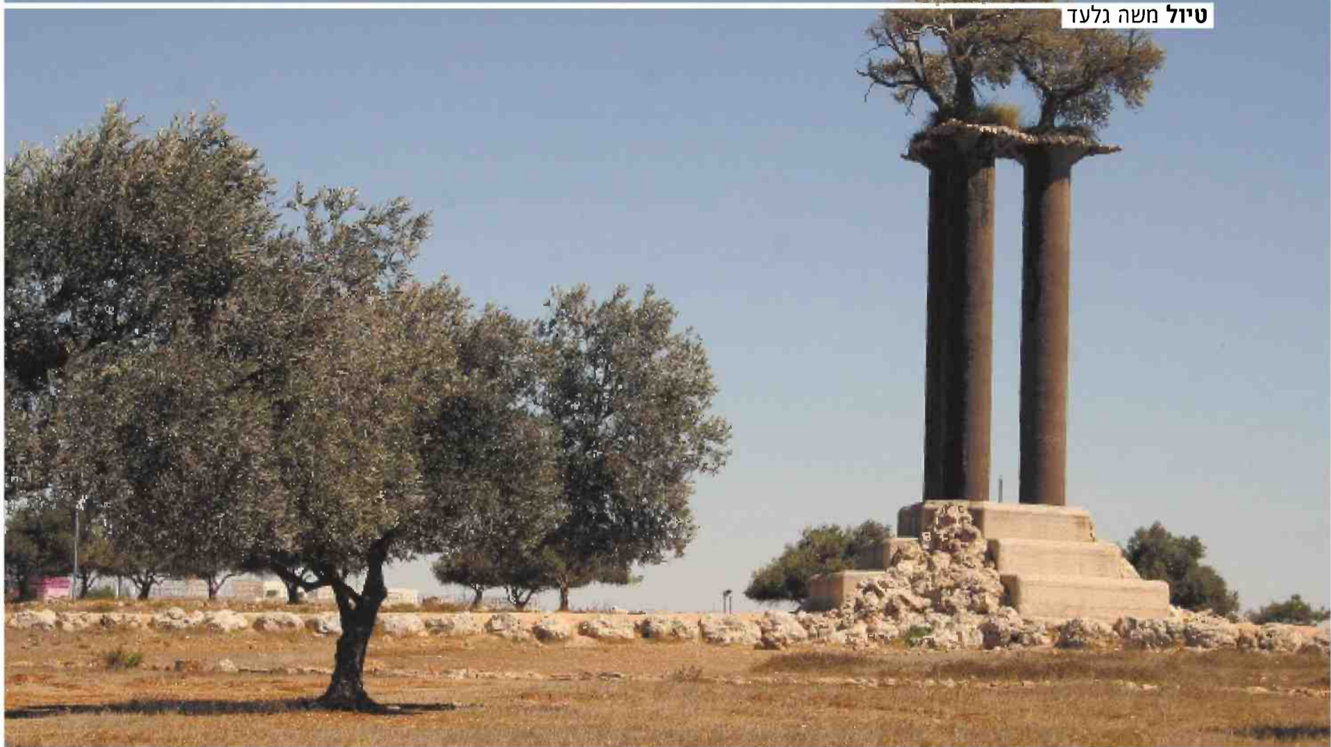
למעלה: פסל "עמודי הזית" ברמת רחל. למטה: זיתים במרכז המבקרים בקיבוץ מגל