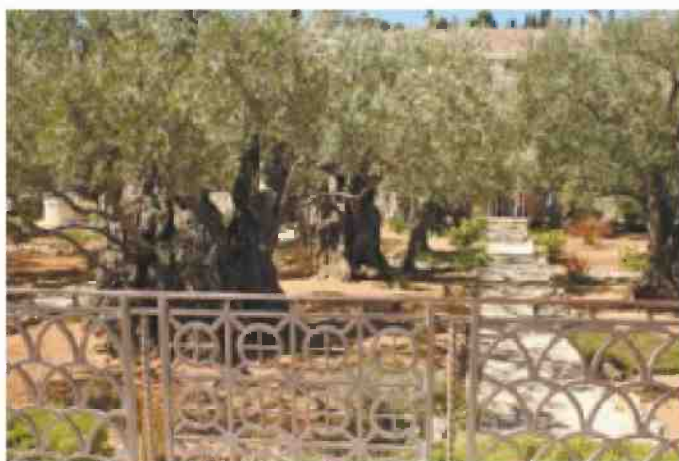
למעלה: כלה בינות לצמד עצי הזית בגן בלומפילד; למטה: עצי הזית בגת שמנים

בית בד גורן: המקום זכה בפרסים רבים בנייה המקום הראשון בעולם בתחרות ב-2011. בית הבד פועל על כביש הצפון 899 ליד שלומי ופארק גורן. במקום מרכז מבקרים, סיורים והרצאות על שמן זית. פרטים: יעקב פנחסי - בית בד גורן www.1111.022.co.il